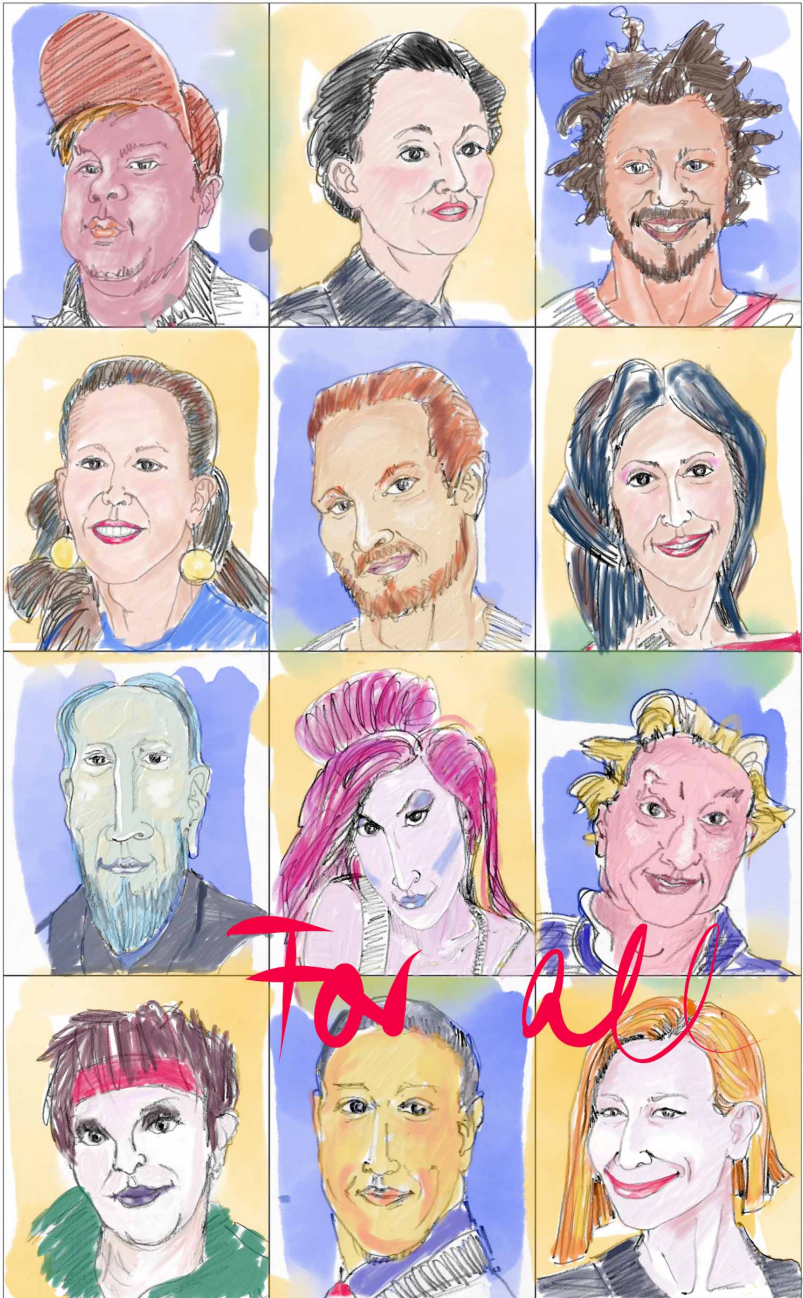
„For all“: Portraits gezeichnet im Frühjahr 2020